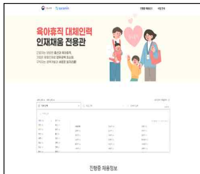
< 사립인 전용관 >

www.saramin.co.kr/zf_user/jobs/theme/matchingbank