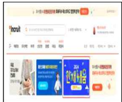
< 인크루트 전용관 >

www.saramin.co.kr/zf_user/jobs/theme/matchingbank