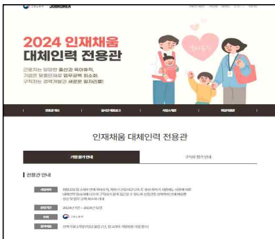
< 잡코리아 전용관 >